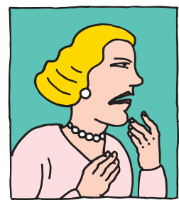
Ira o nerviosismo